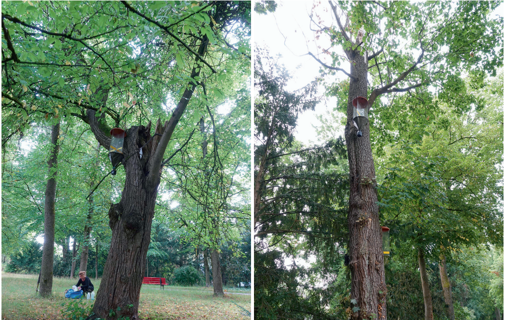
Abb. 2 (links): Flugfensterfalle mit Nachweis von Nematodes filum ♀ an Sommer-Linde; Stadt Regensburg. Abb. 3 (rechts): Flugfensterfalle mit Nachweis von Nematodes filum ♀ an Spitz-Ahorn; Stadt Regensburg.