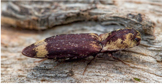
Lacon querceus vom 03.06.2023 im Bamberger Hain.

nung saß ein Exemplar von Trox scaber (Trogidae); Cerambyx cerdo konnte an diesem Baum nicht nachgewiesen werden.