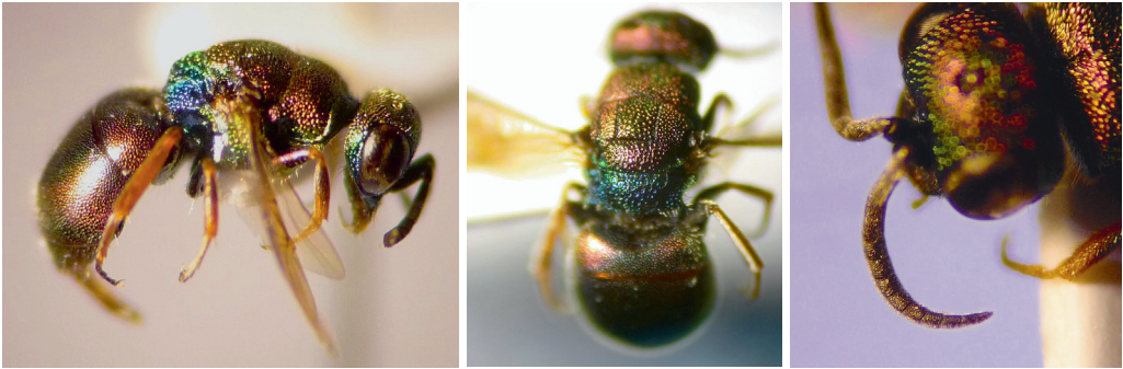
Details der nachgewiesenen Hedychridium femoratum (Dahlbohm, 1854) aus Röthenbach an der Pegnitz 2022.

Erstnachweis Hedychridium femoratum in Bayern: Sandgrube S Röthenbach an der Pegnitz, 49.4670° N, 11.2317° E, 8.7.2022 und 2.8.2022, je 1 ♀.