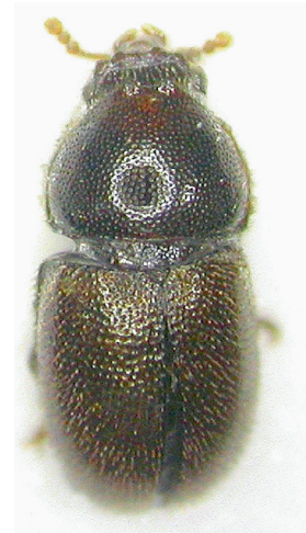
Abb. 1: Männchen von Cis chinensis Lawrence, 1991 aus Flugfensterfalle an Spitz-Ahorn (Stadt Regensburg); Größe: 2,1 mm (Foto: Andrea Jarzabek-Müller, 2023).

Deutschland, Bayern, Stadt Regensburg (N 49°00'49.6" E 012°05'47.7", 353 m üNN); abgestorbener Spitz-Ahorn ( Acer platanoides L.); Flugfensterfalle 4-wöchige Leerung; leg./det. Andrea Jarzabek-Müller 1 ♂ 02.09.2023.