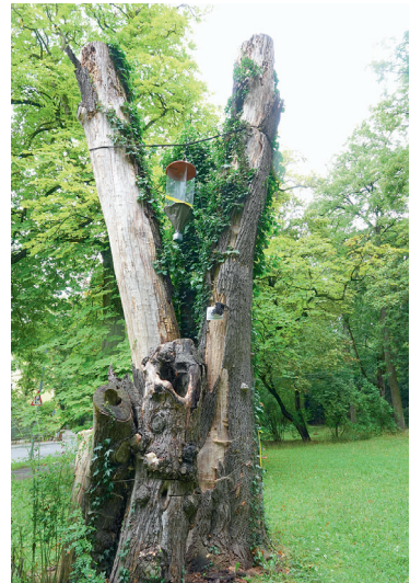
Abb. 2: Flugfensterfalle mit Nachweis von Cis chinensis Lawr. (1 ♂) an Spitz-Ahorn; Stadt Regensburg.