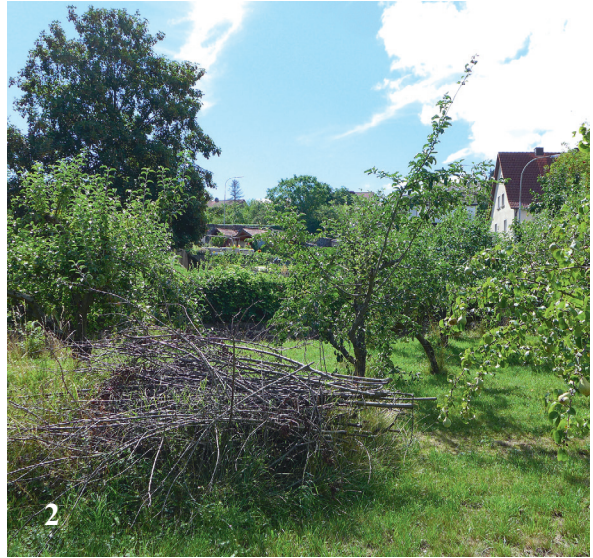
Abb. 2: Fundort von Heriades crenulata in Fladungen (Rhön-Grabfeld). Hausgarten mit Obstbäumen und Totholzstrukturen.

Art dient. Bei dem Fundort handelt es sich um eine trockene, schotterreiche Ruderalflur mit ausgedehnten C. stoebe -Beständen im Bereich von Bahngleisen, abschnittsweise mit Sandtrockenrasen auf natürlichem geologischem Untergrund. Durch seine Lage im städtischen Bereich des Nürnberger Beckens ist der Lebensraum sehr wärmebegünstigt, was durch die großflächige Gleisanlage mit sich stark erwärmenden Gleiskörpern verstärkt wird.