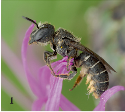
Abb. 1: Weibchen von Heriades crenulata.