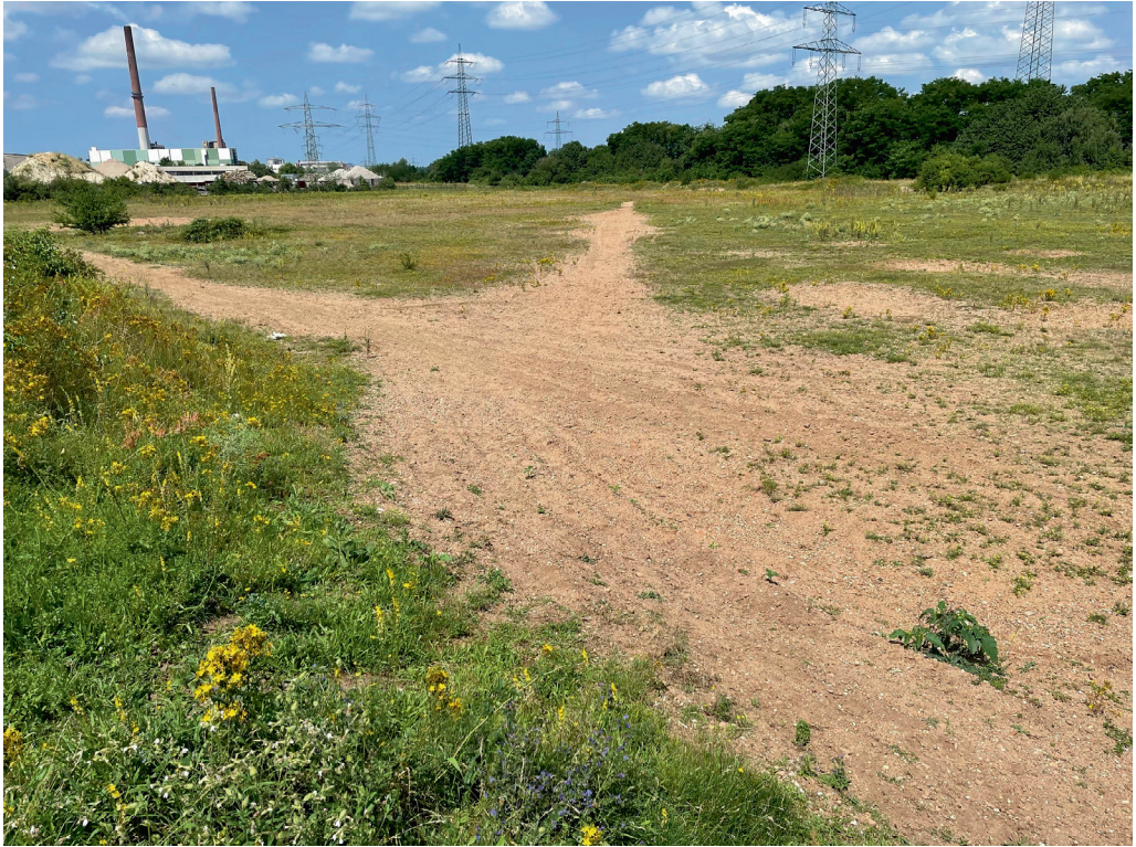
Abb. 3: Auf dieser Brachfläche im Gewerbegebiet in Stockstadt wurde Nomioides minutissimus seit 1997 erstmals wieder in Bayern nachgewiesen.

Fläche vor, Nomioides minutissimus konnte an diesen Pflanzen jedoch, trotz gezielter Suche, nicht gefunden werden. Die Tiere wurden dagegen an Eryngium campestre und an Helichrysum arenarium beobachtet. Auch für die „Eberstädter Düne“ berichten DRESSLER A. & R. (1992), dass die Art nur selten an Thymus serpyllum zu finden sei. Sie beschreiben als Hauptpollenquellen u. a. Sedum acre , der auf der Stockstädter Fläche sehr dominant ist, Sedum album , Nigella arvensis und Echium vulgare . BURGER (pers. Mitt.) erwähnt außerdem Potentilla argentea , die in Stockstadt häufig ist, und Centaurea sp., die im Randbereich ebenfalls vorkommt.