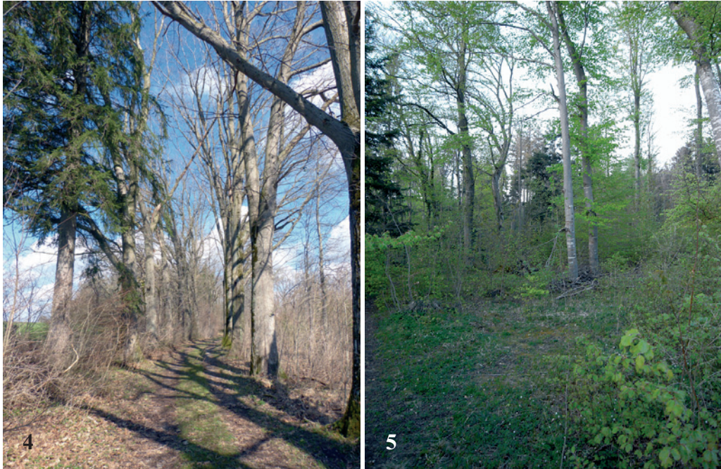
Abb. 4, 5: Fundorte von Eudonia delunella (STAINTON, 1849) in Bayern. Abb. 4: Roteichen-Allee im Norden von Murnau, Lkr. Garmisch-Partenkirchen. Abb. 5: Abbruchkante zum Lech im SW des Westerholzes, Lkr. Landsberg a. Lech.

Der Fundort im Westerholz ist ein lichter Mischwald direkt an der über 30 m hohen Abbruchkante zum Lech und zeichnet sich durch eine hohe Luftfeuchtigkeit aus. Moose bewachen hier z. B. Buchen, Bergahorne und Eschen. Im Winter 2013/14 wurde dieser Bereich stark ausgelichtet, weswegen die Abb. 5 vom April 2014 nicht mehr ganz den vorjährigen Zustand wiedergeben kann.